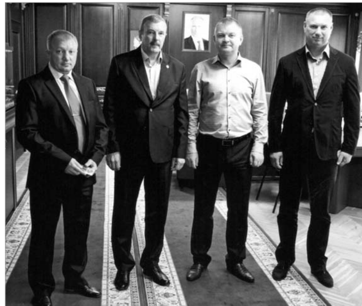
Ветераны ВКР в Керчи.

75 лет назад была создана легендарная советская военная контрразведка «СМЕРШ». Эта короткая ёмкая аббревиатура из пяти букв водела ужас на врагов. «Смерть шпионам» или коротко «СМЕРШ» существовал недолго, около трёх лет - с 1943 по 1946 годы, однако, до сих пор признается самой эффективной специальной службой в мире, которая приблизила наступление Победы в Великой Отечественной войне.