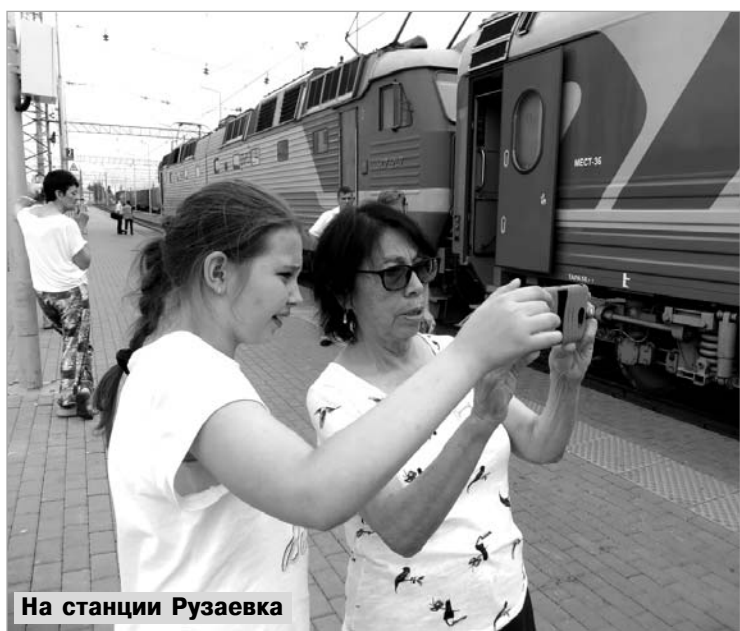
На станции Рузаевка

Час ночи 2 июля. Наша сборная только что выиграла у испанцев и прошла в четверть финала чемпионата мира. Москва гудит, кричит, восторгается - всюду флаги и радостные улыбки.